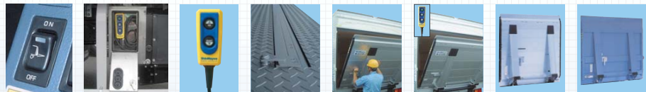
キャブ内メインスイッチ (埋込型) | リモコンスイッチ (3つボタン/開閉・上・下) ※手動開閉式は2つボタン | 庫内リモコンスイッチ (2つボタン/上・下) | キャスターストップバ (カンヌキ式ロック) | 手動開閉式ゲート (補助スプリング付) | 油圧開閉式ゲート | アルミ製ゲート | スチール製ゲート