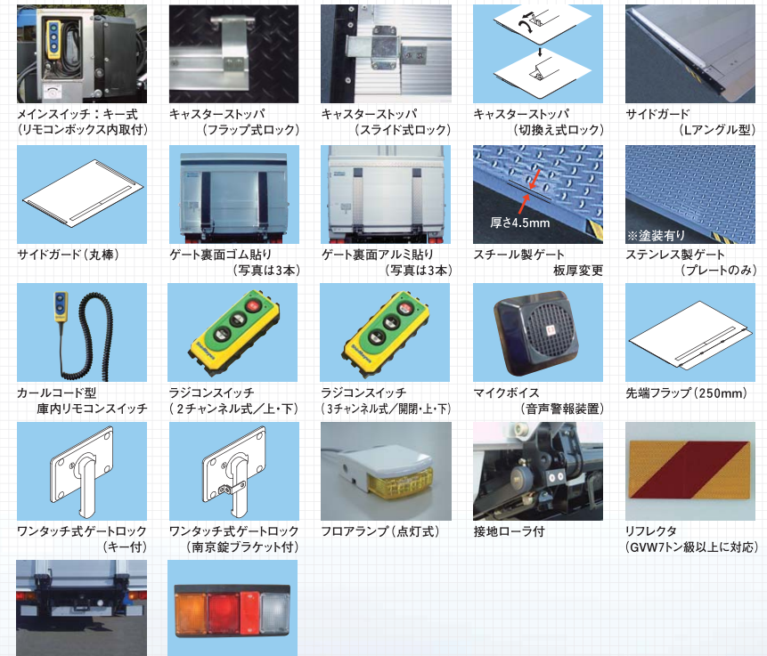
メインスイッチ：キー式 (リモコンボックス内取付) | キャスターストップバ (フラップ式ロック) | キャスターストップバ (スライド式ロック) | キャスターストップバ (切換え式ロック) | サイドガード (Lアングル型) | サイドガード (丸棒) | ゲート裏面ゴム貼り (写真は3本) | ゲート裏面アルミ貼り (写真は3本) | スチール製ゲート 板厚変更 (厚さ4.5mm) | ※塗装有り | ステンレス製ゲート (プレートのみ) | カールコード型 庫内リモコンスイッチ | ラジコンスイッチ (2チャンネル式/上・下) | ラジコンスイッチ (3チャンネル式/開閉・上・下) | マイクボイス (音声警報装置) | 先端フラップ (250mm) | ワンタッチ式ゲートロック (キー付) | ワンタッチ式ゲートロック (南京錠プレート付) | フロアランプ (点灯式) | 接地ローラ付 | リフレクタ (GVW7トン級以上に対応) | アルミ製バンパ (GVW8トン級未満に対応) | 小型テールランプ